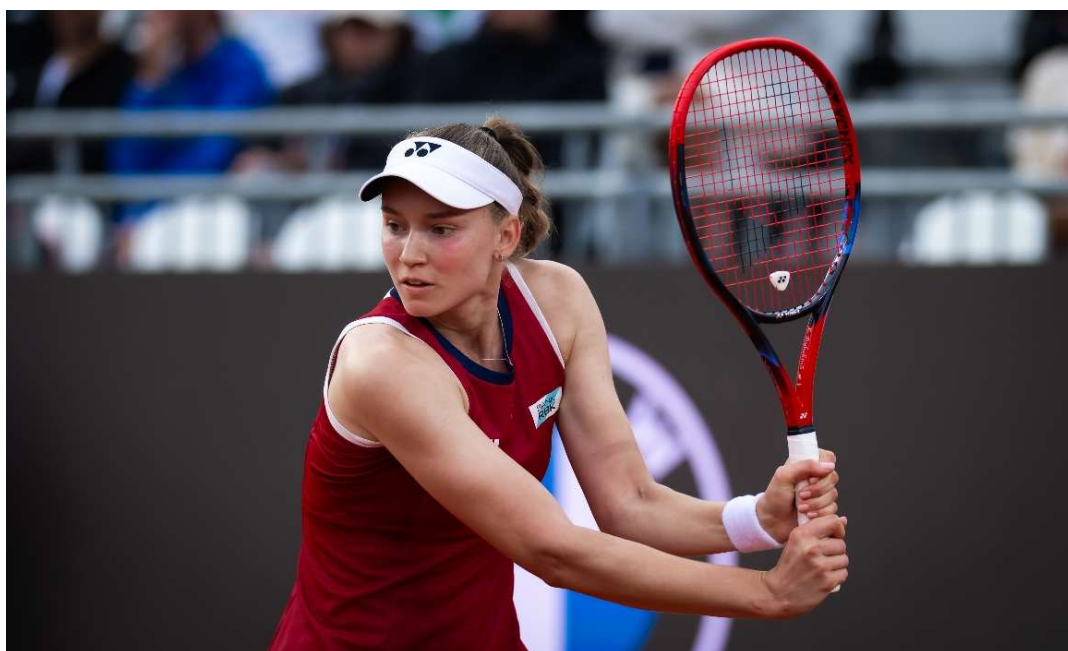
エレナ・ルバキナ選手(※2位/カザフスタン)