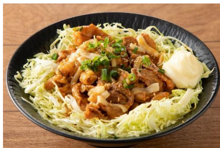
チーズ豚キムチ丼 1,100円