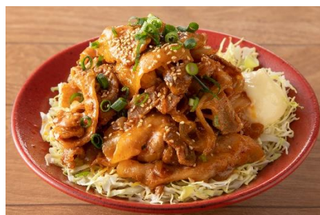
具材2倍！豚キムチ丼 1,470円

* 価格は全て税込です。メニュー代金とは別に、デリバリーサービスが定める配達手数料がかかります。詳細はデリバリーサービスのウェブサイトをご確認ください。