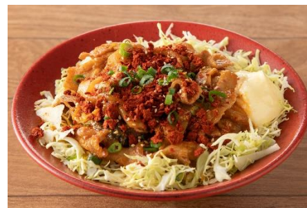
ピリ辛豚キムチ丼 1,100円