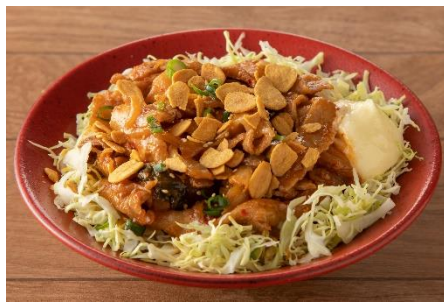
スタミナパンチ豚キムチ丼 1,100円