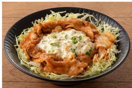
自家製タルタル豚キムチ丼 1,100円