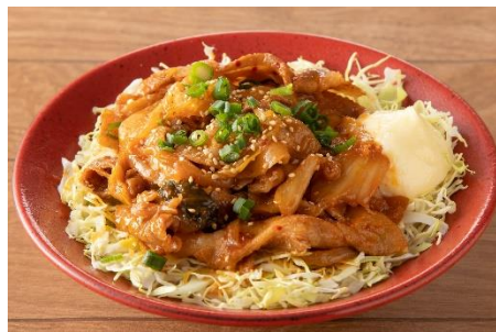
定番！豚キムチ丼 1,040円