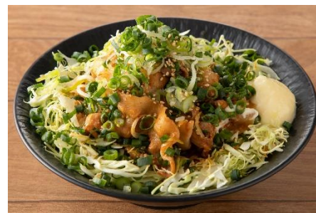
葱だく豚キムチ丼 1,180円