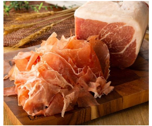
切り出しプロシュート 790円～