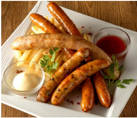
ソーセージ3種とフライドポテト盛り合わせ 1,690円