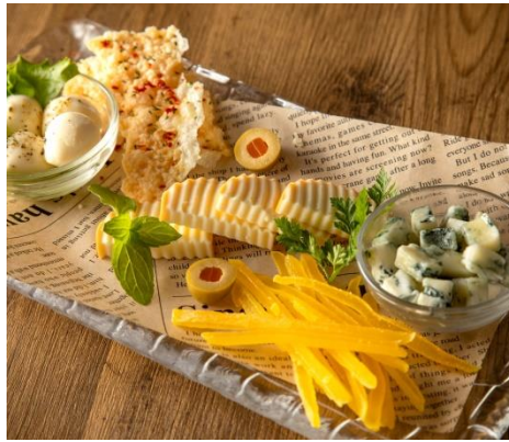
4種チーズ&ドライマンゴーの盛り合わせ 890円