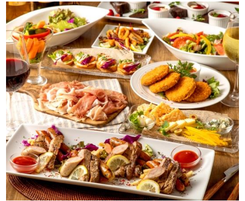
パーティーコース〈飲み放題付き〉 4,000円～