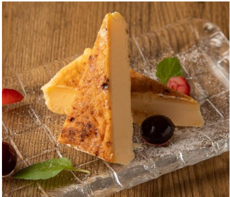
花畑牧場のクリームカタラーナ 530円