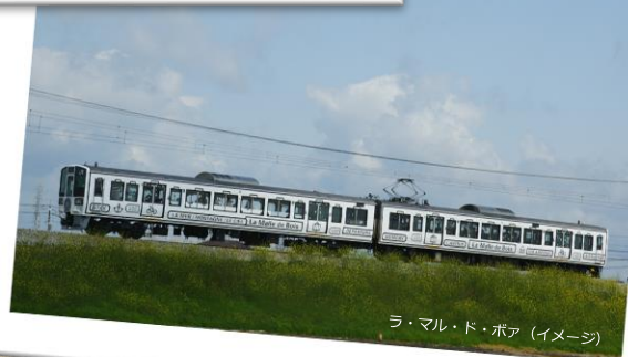
ラ・マル・ド・ボア (イメージ)

せとうちエリアの観光列車「ラ・マル・ド・ボア」に乗りして ユネスコ無形文化遺産に登録された白石踊と、日本遺産の一部である巨 石の下に建てられた開龍寺を学びながら楽しむ日帰りツアーです。