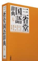
現代の生きた日本語がわかる 三省堂国語辞典 第七版