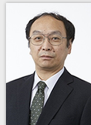
【三省堂現代新国語辞典】 編集委員 小野正弘