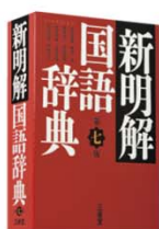
ことばの本質をとらえる 新明解国語辞典 第七版

そんたく 「忖度」(「忖度」)する(他サ)「忖」も「度」も推し量る意) 何らかの意味で苦境に立たされている人について、その心情などを、第三者があれこれと推測すること。また、その推測。「新明解国語辞典」風