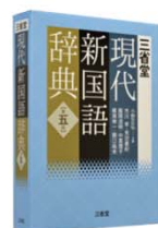
現代文・評論文を読み解くための 三省堂現代新国語辞典 第五版

【三種の国語辞典それぞれの性格によって、説明のしかたも少しずつ異なります。それぞれの説明の違いも合わせてお楽しみ下さい】