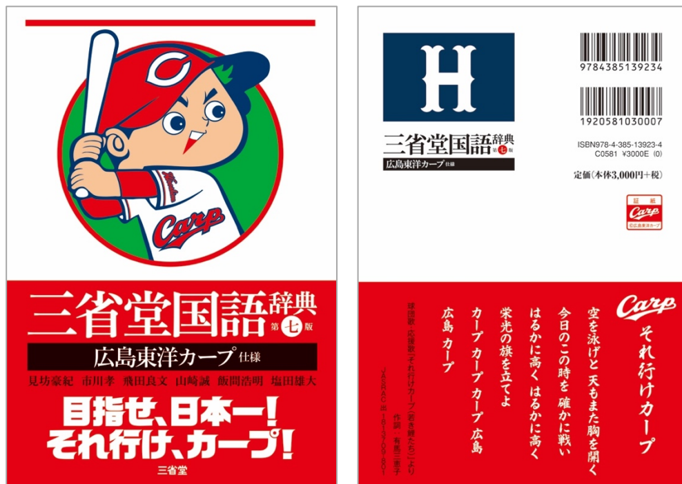
ケース表1はもちろんカープ坊や

《参考》三省堂の辞書名入れサービスのご案内 https://www.sanseido-publ.co.jp/naire_dic.html