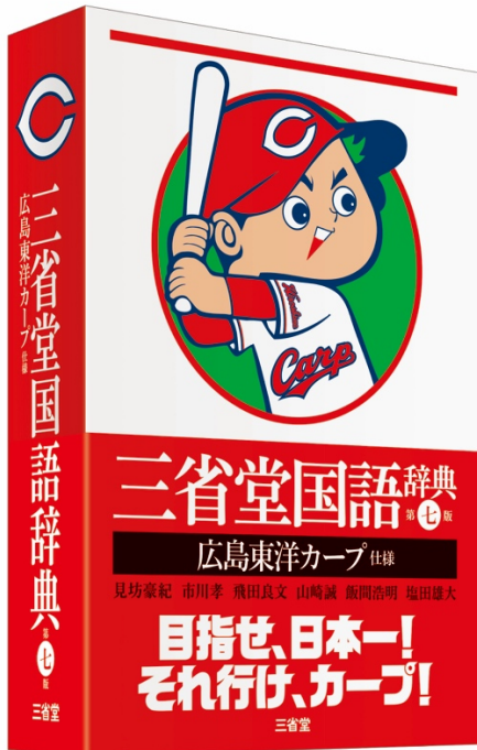
装丁まるごとカープ仕様