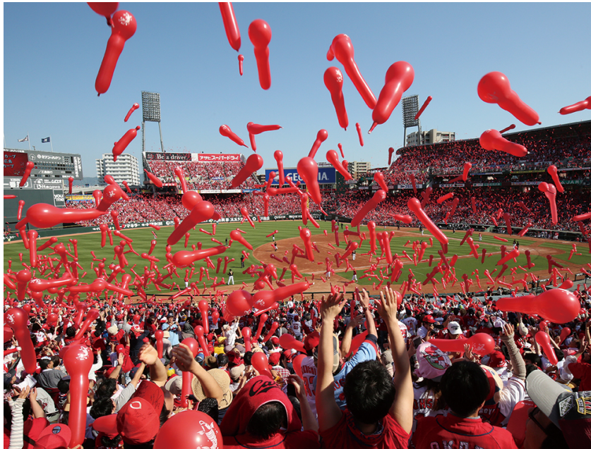
前見返しにはマツダスタジアムの写真を全面掲載

前見返しには、大歓喜に包まれ、碧天に赤いジェット風船が舞い上がるマツダスタジアムの写真を全面掲載しました。