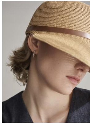
ハット 19,800円 ピアス 16,500円