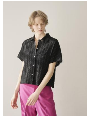
ブラウス 20,900円 パンツ 41,800円