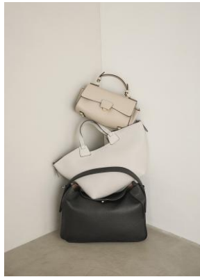
バッグ (上から) 35,200円/41,800円/38,500円