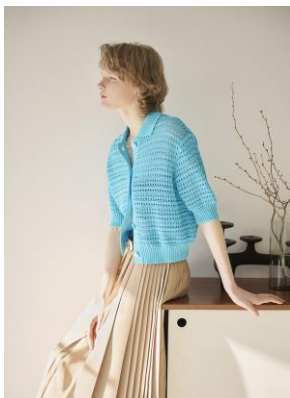
ニット 28,600円 スカート 35,200円