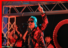
JB ORGA BAND with MOMO