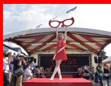
めがねファッションショー