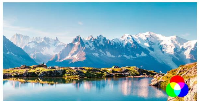
BenQ DLP Projector - 6ヵ月使用後