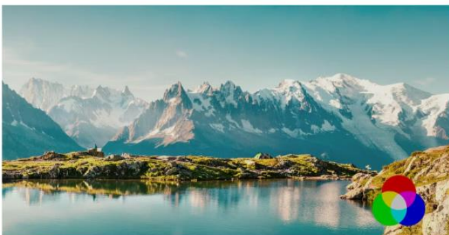
Non-DLP Projector - 6ヵ月使用後