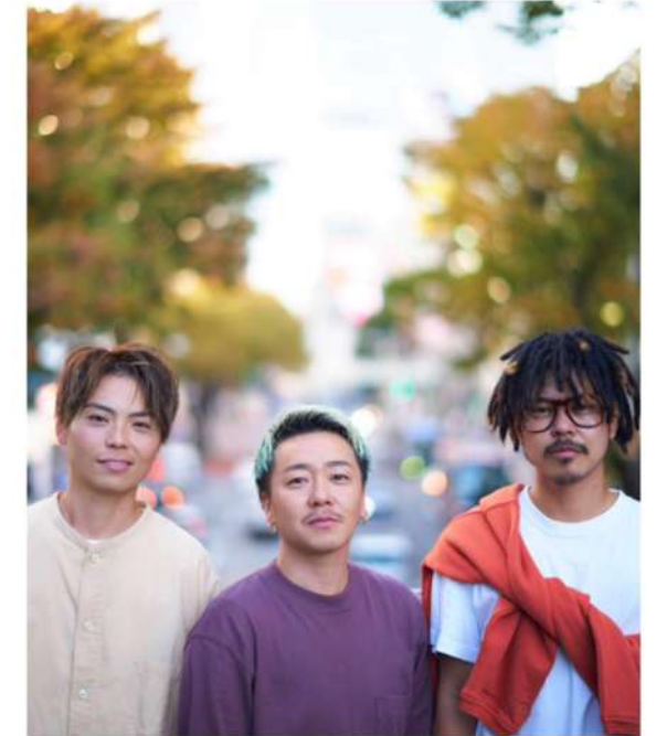
ミュータントウェーブ ジェンダリスト 元なでしこ女子サッカー選手