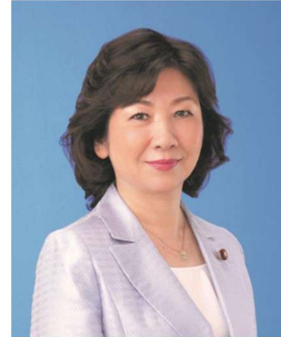
野田 聖子 衆議院議員