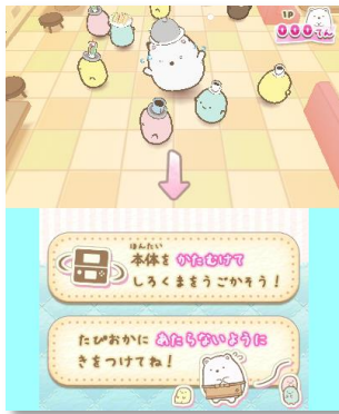
ご注文はこちらですか？

尚、ゲーム中に遊べるようになったミニゲームは、通信プレイで最大5人で楽しむことができます。（ローカルプレイ、ダウンロードプレイに対応しています。）