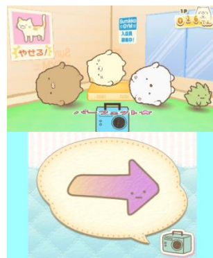
みんなでフィットネス♪