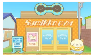
ねこのフィットネスジム