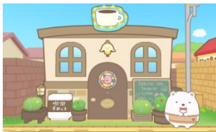
しろくまの喫茶店