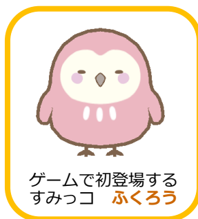
ゲームで初登場する すみっこ ふくろう

応募期間（2015年11月19日～11月30日※最終日消印有効）内に、商品パッケージ内に封入されている「アンケートはがき」を弊社へご送付頂いたお客様の中から、 抽選で1,000名の方に、本作で初登場するすみっこ「ふくろう」の、ゲーム限定仕様でのりぬいぐるみ（サンエックス社製）をプレゼント いたします。