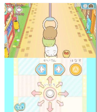
アームで、すみっコたちへ いたずらもできちゃう！