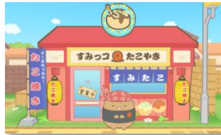
とんかつのたこ焼き屋