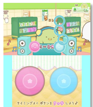
ノリノリDJステージ♪