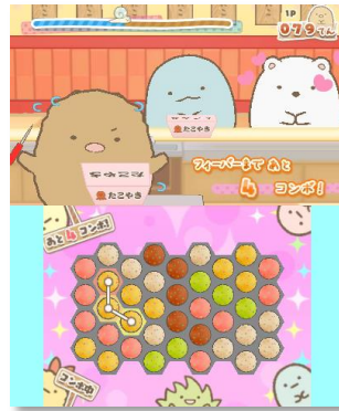
コロコロたこやき