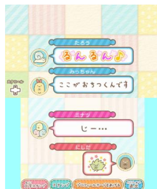
おともだちとスタンプ トークで盛り上がりよう！