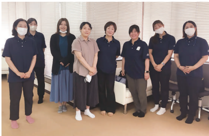
上：訪問看護ステーション コルディアール葛飾の職員の方々。