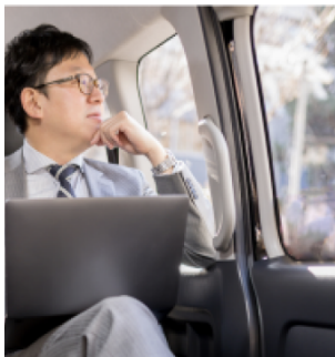
ホテルからお好きな場所まで快適に