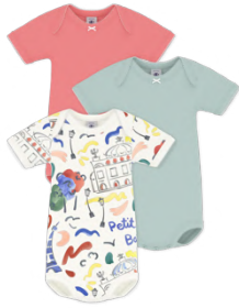
プリント半袖ボディ 3枚組 6,600円 品番: A0FUT00