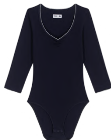
ボディスーツ 12,100円 品番: A0G8501