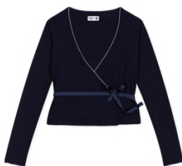
カシミアトップ 15,400円 品番: A0FUQ01