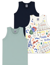
タンクトップ 3枚組 7,700~8,250円 品番: A0FU800