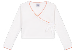
カシミアトップス 9,350~9,900円 品番: A0FUL02