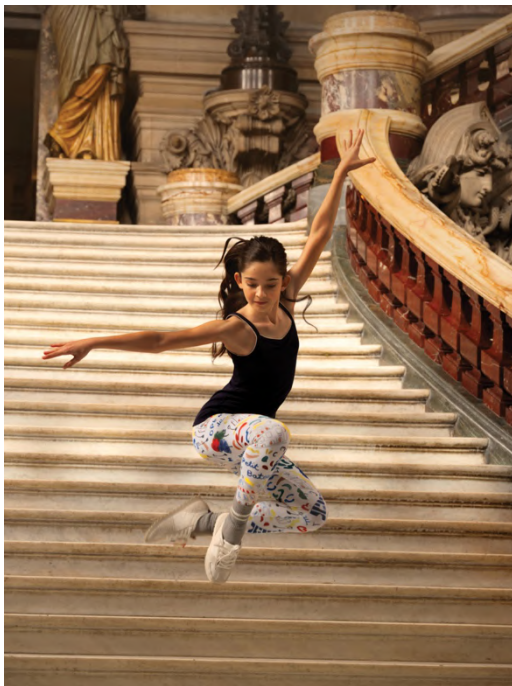
1x1 リブ編みキャミソール/7,700~8,250 円、 カルソン/6,600~7,150 円

ウィメンズでは、ボディスーツやカシュクールなど、バレエの定番アイテムを現代的に再解釈。しなやかなコットン素材により、快適な着心地と美しいシルエットを両立しています。