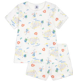
半袖パジャマ 7,150~7,700円 品番: A0FU701