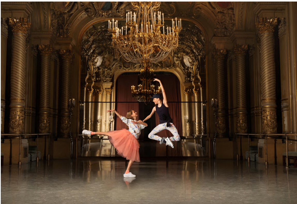
左：スウェット/13,200~14,300円、チュールスカート/15,400~16,500円 右：タンクトップ/7,700~8,250円、カルソン/6,600~7,150円