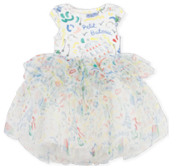
チュールワンピース 22,000~23,100円 品番: A0FUN01