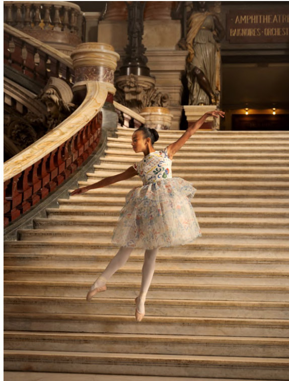
チュールワンピース/22,000~23,100円