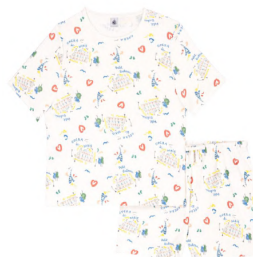
半袖パジャマ 15,400円 品番: A0FUD01