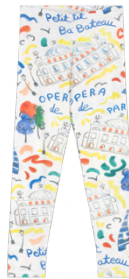
カルソ 6,600~7,150円 品番: A0FUO01