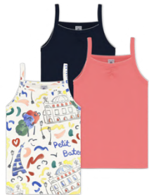
キャミソール 3枚組 7,700~8,250円 品番: A0FU300