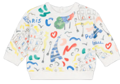
スウェット 10,450円 品番: A0FU601