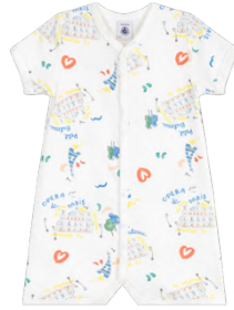
プリントショートロンパース 6,600円 品番: A0FUT00