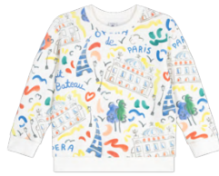
スウェット 13,200~14,300円 品番: A0FVY01