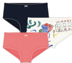
ショーツ 3枚組 5,500~6,050円 品番: A0FU400