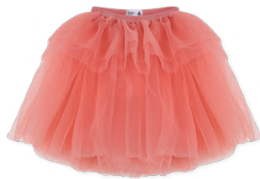
チュールスカート 15,400~16,500円 品番: A0FUM02