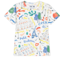
半袖Tシャツ 6,600~7,150円 品番: A0FWD01