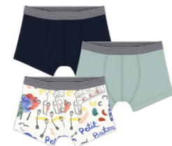
トランクス 3枚組 6,050~6,600円 品番: A0FW000