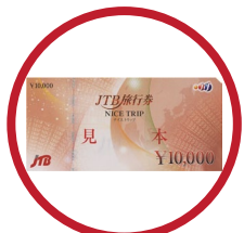
旅行券「JTB ナイストリップ」5万円分 1名様