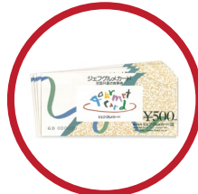
全国共通お食事券 50,000円分 1名様