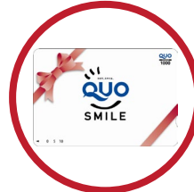
QUO カード 10,000円分 20名様