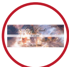
ニューオータニギフト券 1.5万円分 1名様