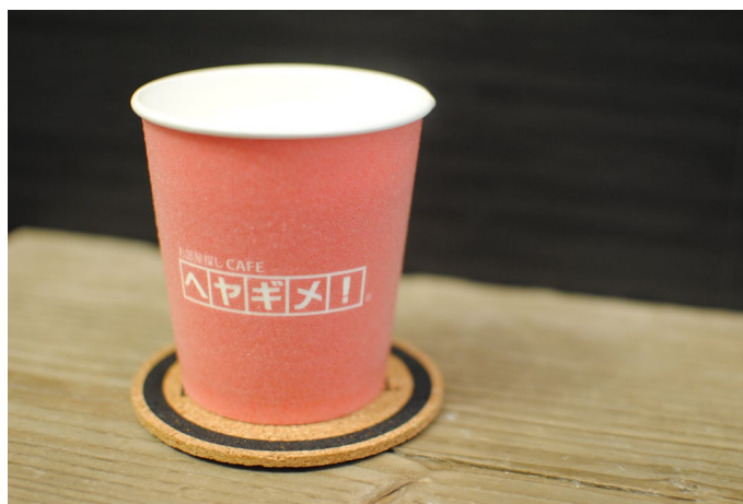
< お部屋探し CAFE ヘヤギメ! オリジナルカップ >