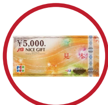
商品券「JTB ナイスギフト」1万円分 1名様