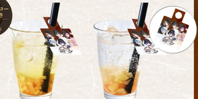
ごろごろマンゴーソーダ