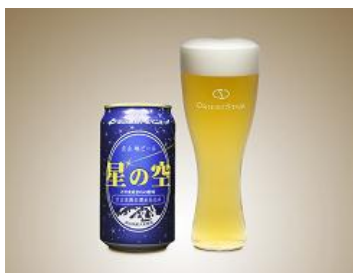
<オリエントスター スペシャルビールギフトセット>