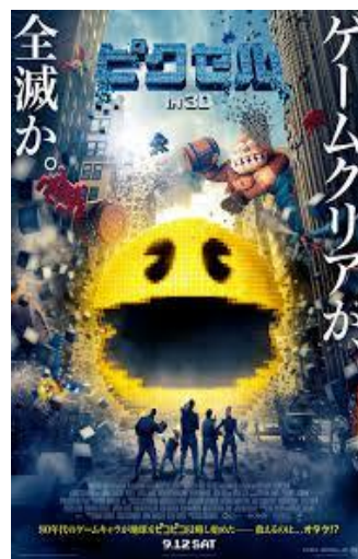
PIXELS ©2015 CTMG. PAC-MAN™