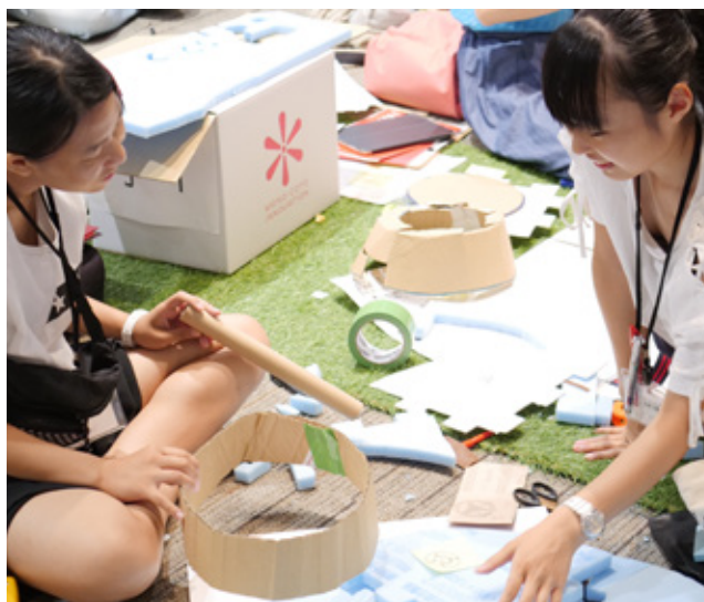
MONO-COTO INNOVATION 2019 より