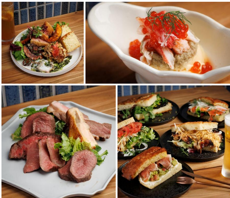
(左上①・右上②・左下③・右下④の画像)