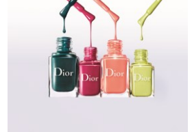
ディオールヴェルヴェ 限定品3色・新色1色 3,000円