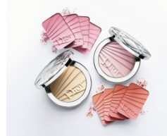
ディオールスキン ヌードエア パウダー コンパクト 限定品2色 7,000円