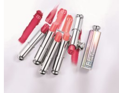
ディオール アディクト リップスティック 限定品5色 3,900円