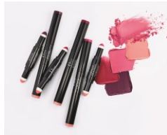
ルージュ グラディエント 限定品3色 4,200円