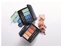
カラー グラデーション パレット 限定品2色 7,600円

ニュー ルック スプリング 2017 「カラーグラデーション」 2016年1月6日(金)限定・新発売 http://bit.ly/2iG06M9