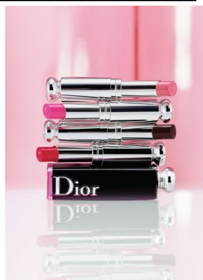
ジェニファー・ローレンス 使用色