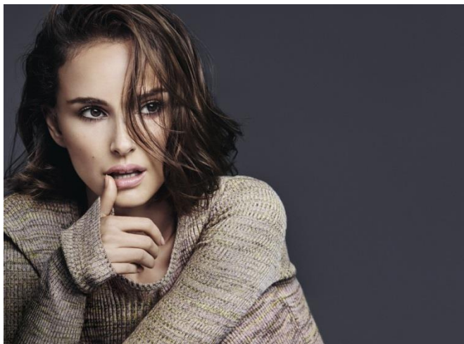
ナタリー・ポートマン