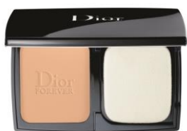
ディオールスキン フォーエヴァー コンパクト エクストレム コントロール 全7色 7,000円(税別) リフィル 6,000円(税別)