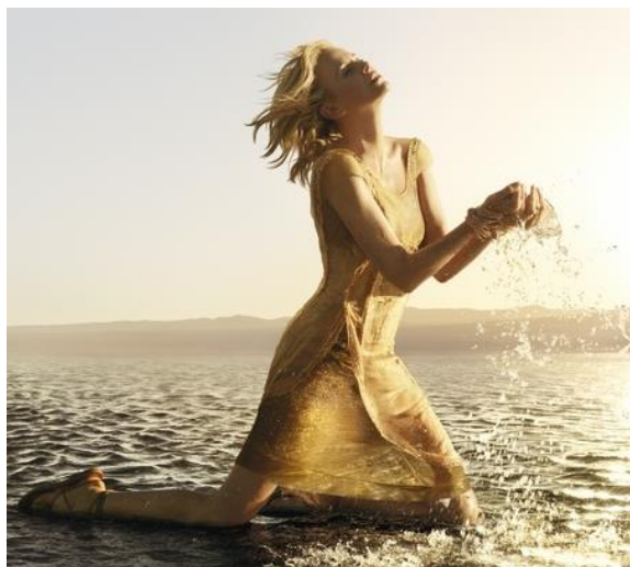
シャーリーズ・セロン