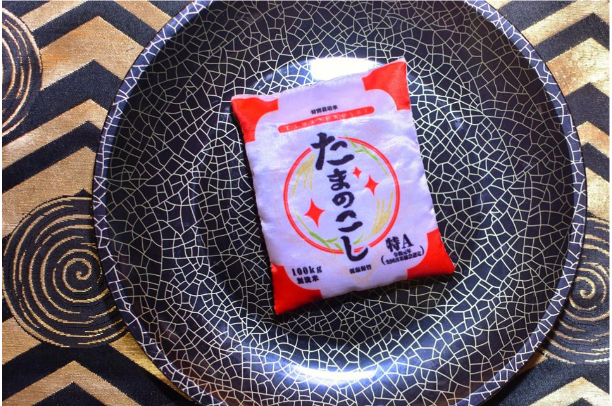
▲たまのこし ちよっぴり当たりの銘柄。他の種類よりも少しおおきいです。