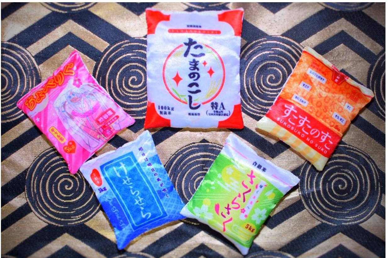
▲全種集合 全5種+シークレット1種