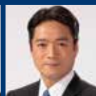
尾崎正直 (高知県知事)