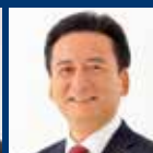
山口祥義 (佐賀県知事)