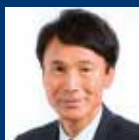
三反園訓 (鹿児島県知事)