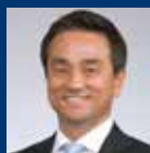
村岡嗣政 (山口県知事)