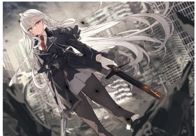
遠坂あさぎ ラフィラスト

遠坂あさぎ ReDrop スカイ 雨傘ゆん 紅シャケ 西出ケンゴロー Akizone 緋/wata KFR スコッティ