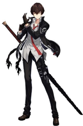
アキヤマ・シリウ (CV.福山潤)

日本版の主題歌は人気声優 水樹奈々さんによる、『COUNTER: SIDE』のための新規楽曲、メインキャラクターには福山潤さん、日笠陽子さんといった有名声優含め 50 名以上の声優を起用いたします。