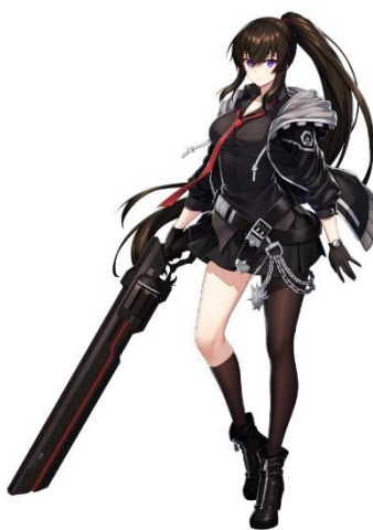
ヤナギ・ミナ (CV.水樹奈々)