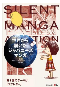
『世界から届いたジャパニーズマンガ -第1回サイレントマンガオーディション』 (コアミックス刊)

また eBookJapan は、『SKY SKY』を含む第1回サイレントマンガオーディション受賞作品を集めた単行本の電子書籍版を本日より先行配信します。