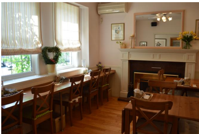
マンガカフェ店内イメージ

eBookJapan では、本イベントを応援する取り組みの一環として、福島アニマガフェスタ！実行委員会がイベント期間中に運営する「マンガカフェ」にて、人気タイトルの電子書籍版が200冊以上無料で読める、読み放題サービスを提供いたします。この取り組みは講談社や集英社などの出版社や著作権者の全面的な協力のもと、実現したものです。