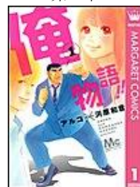
俺物語!! アルコ/河原和音