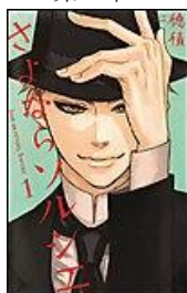
さよならソルシエ 穂積