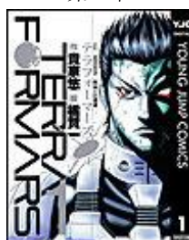
テラフォーマーズ 貴家悠/橘賢一