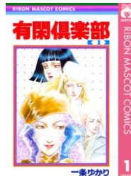
『有閑倶楽部』 一条ゆかり