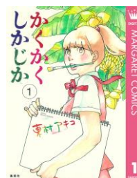
『かくかくしかじか』 東村アキコ