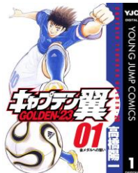
『キャプテン翼 GOLDEN-23』 高橋陽一