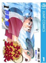
『テニスの王子様』 許斐剛

・2週目（9月24日～10月7日）：『テニスの王子様』（1巻）、『キャプテン翼 GOLDEN-23』（1巻）、『有閑倶楽部』（1巻）ほか計13作品