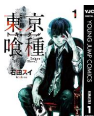
『東京喰種トーキョーグール リマスター版』 石田スイ