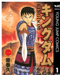
『キングダム』 原泰久