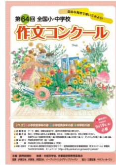
※第64回全国小・中学校作文コンクールの募集ポスター