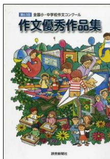
※第63回全国小・中学校作文コンクールの「作文優秀作品集」