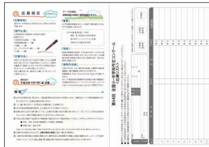
※第64回コンクールの応募要項