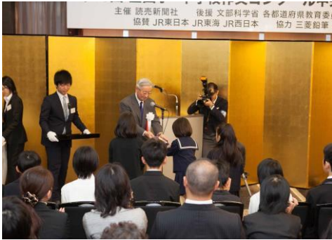
※過去の授賞式より