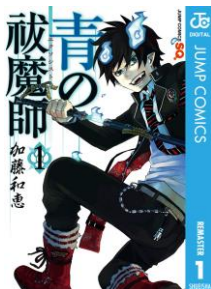
『青の祓魔師 リマスター版』 加藤和恵