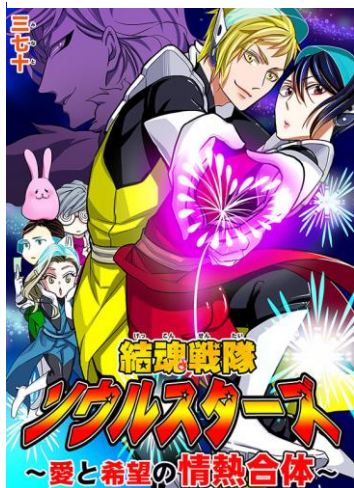
『結魂戦隊ソウルスターズ～ 愛と希望の情熱合体～』 著：三七十