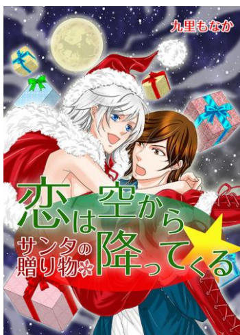
『恋は空から降ってくる —サンタの贈り物—』 著：九里もなか