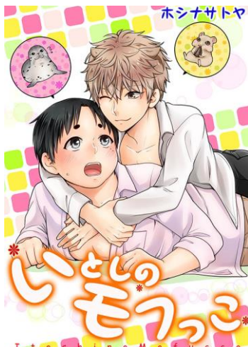
『いとしのモフっこ』 著：ホシナサトヤ

【本件についてのお問い合わせ先】 株式会社イーブックイニシアティブジャパン 広報担当：木元 TEL：03-3518-9544 FAX：03-3518-9131 MAIL： pr@ebookjapan.co.jp