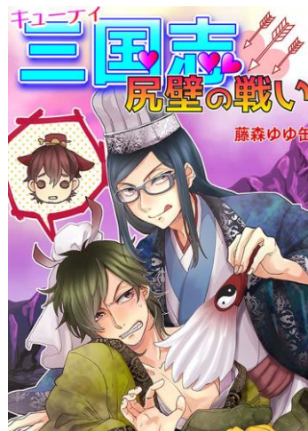
『キューティー三国志 —尻壁の戦い—』 著：藤森ゆゆ