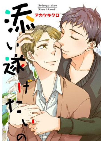
『添い遂げたいの』 著：アカツキクロ