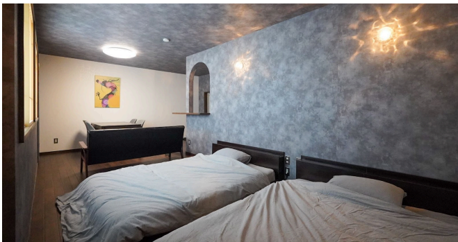
ワンルームタイプ内観