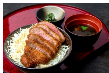
【新】『特選ソースカツ丼』950円 (+税)