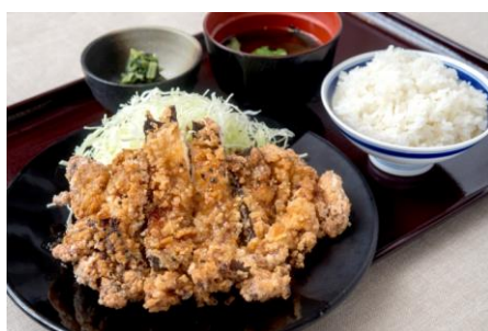
【新】『鶏の三味香ばし揚げ』880円 (+税)