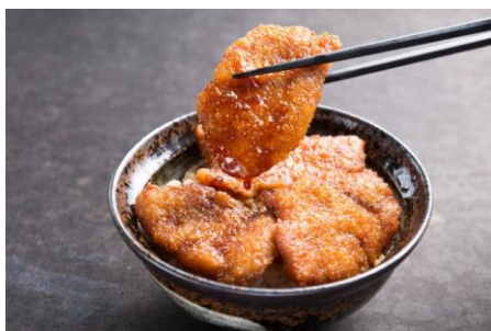
豚たれカツ丼：850円 (+税)

ランチタイムは 11:00～15:00。京都勝牛の新定番メニューとして人気の「たれカツ」が、850円～で召し上がって頂けます。醤油ベースの濃厚な甘辛ダレに浸した揚げたての牛カツは、ご飯との相性抜群の一品！また「奈良柏木店」からは 新メニュー登場！ 「にんにく・しょうが・ブラックペッパー」の三味が食欲をそそる『鶏の三味香ばし揚げ』や、甘めのソース2種類にアクセントで和からしをきかせた『特選ソースカツ丼』が新登場！京都勝牛の味をよりお手頃楽しんでいただけるようになりました。