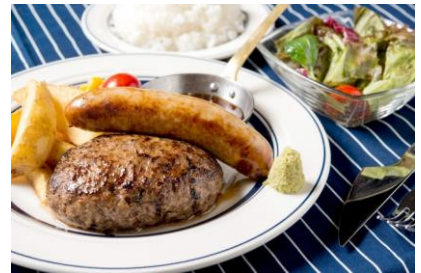
熟成牛ハンバーグランチ：880円 (+極太ソーセージトッピング：360円)