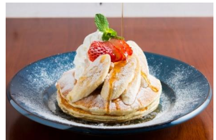
メープルバナナパンケーキ：1,180円