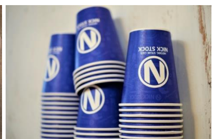
ホットコーヒー：330円 (+税)