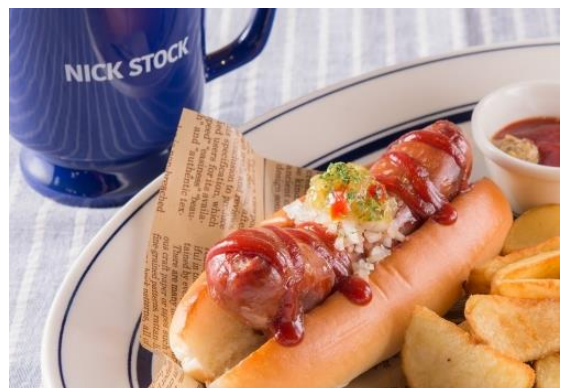
一口噛めばパリッと肉汁弾ける！