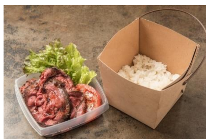
ローストビーフ BOX：880円 (+税)