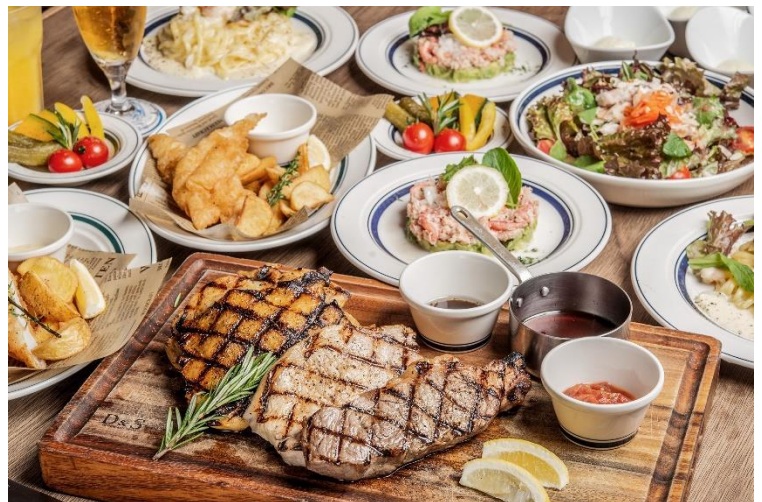
ニックストック名物！総重量 1kg の肉盛り「ニックビレッジ」！