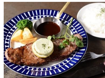
ステーキランチ各種 1380円 (+税) ~