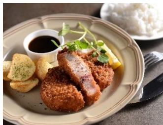
北海道産：厚切りとんかつランチ 1180円 (+税)

週末【金・土・祝前日】は、深夜3時まで営業しているので、2軒目3軒目のご利用にも最適です。カップルや気の合う仲間と、もちろんお一人様でもOK！お気軽にご利用ください。