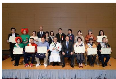
2017年度大賞『餅つき餅カレー』