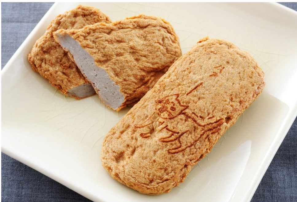
表面に焼印したミイちゃん