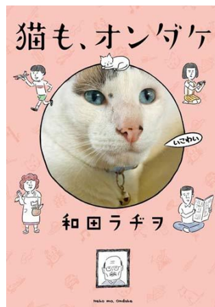
「猫も、オンダケ」©和田ラヂヲ / 株式会社KADOKAWA