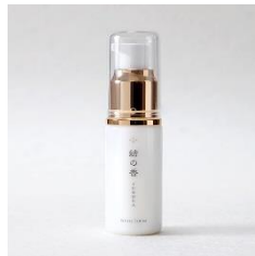
2018年度大賞『結の香 ホワイトセラム』