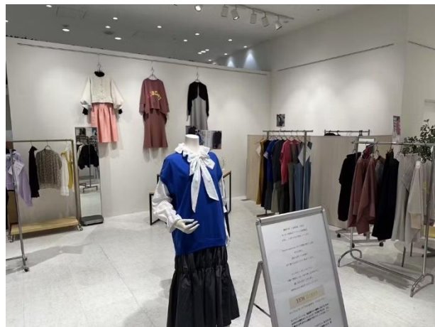
2月になんばマルイで実施した ポップアップストア

【ブランド紹介ページ（クラウドファンディング）】 https://camp-fire.jp/projects/722150/view