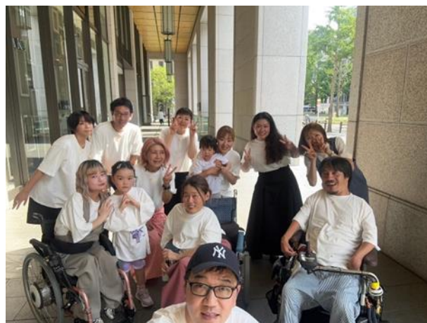
8月に行った開発に関わった方との 懇親会&撮影会