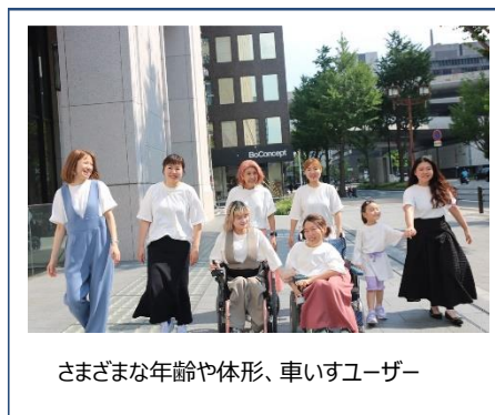
さまざまな年齢や体形、車いすユーザー

補助金により開発資金も確保でき、企画段階からさまざまな年齢や体形、車いすユーザーの意見を取り入れ試作を繰り返すことで、「一枚着からインナー使いまで幅広く活躍するカメレオンシアートップス」「ミセスや車いすユーザーも楽に着こなせるサロペット」「立ち姿はもちろん座ったシルエットもきれいに魅せるマーメイドスカート」「手軽に着脱できるマグネットボタンの採用」など、デザインと機能性を併せ持ち、年齢や体形、障がいの有無によらず誰もが楽しめるインクルーシブファッションが完成しました。