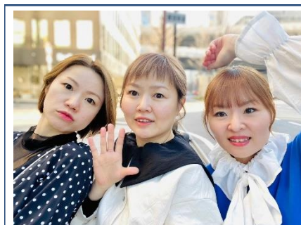
左より三女・長女（代表）・次女