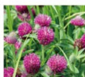
レッドクローバー※1