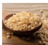
玄米麹 アスペルギルス培養物※3