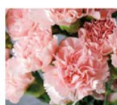
ピンクカーネーション※2