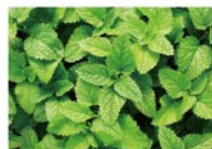
オーガニックペパーミント※1