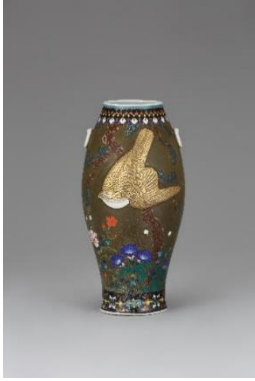
磁胎七宝陽刻上絵金彩鷹図花瓶

今回の展示では、こうした二人のナミカワのルーツでもある「尾張七宝」の精華を一堂にご覧いただきます。(協力：あま市七宝焼アートヴィレッジ)