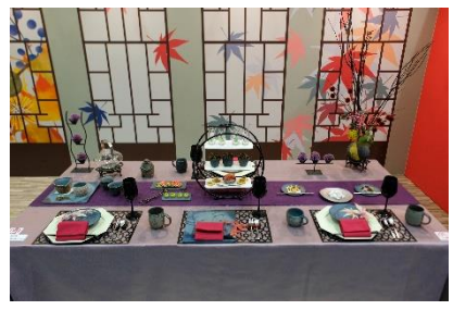
写真は、昨年の展示