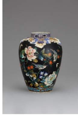
染付金彩磁胎七宝花鳥図花瓶