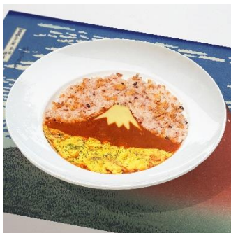
(1) 赤富士オムハヤシ

歌川広重の浮世絵作品には、笑顔でわらび餅をつくる情景を描いた作品があります。そこから想起したわらび餅を使用したデザートドリンクです。注文いただいた方には、展覧会でも使用されている代表的な浮世絵が描かれた、全4種のオリジナルコースターからランダムで1枚プレゼントします。