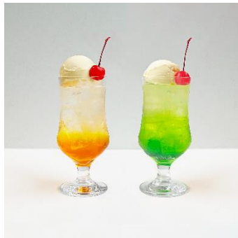
(2) 浮世絵クリームソーダ