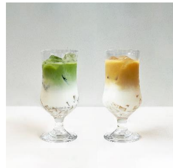
(3) 飲むわらび餅 (左：抹茶、右：ほうじ茶)