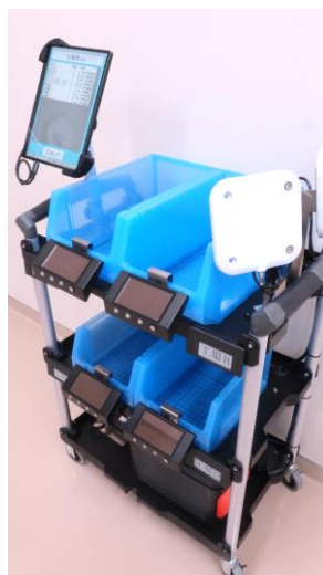
マルチピッキングカート