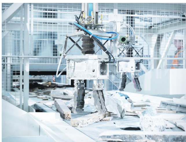
【ゼンロボティクス製品写真】