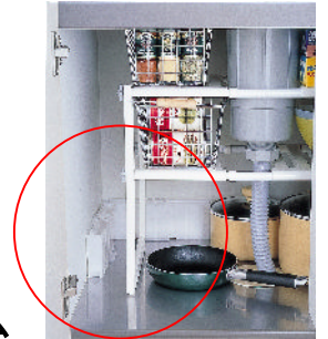
●除湿棒®・つながるスリム