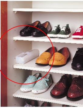
●除湿棒®・タンス用

雨がが続くと、家の中の湿気と、洗濯物が外に干せないで室内干しのニオイが気になりますね。押入れの隅など狭くて奥行きがあるところにぴったりの「除湿棒」の成分は、吸収能力の大きい食品添加用塩化カルシウムです。吸湿面からゲンゲン吸湿して塩化カルシウムの結晶が水になるタイプです。つめかえ式で、タンクタイプよりもゴミの少ない省ゴミ設計になっているのが環境にやさしい。「除湿棒」のつめかえ用の吸湿パックは、湿気は透すけれど、水は通さない膜(透湿防水多孔質膜)を採用。使用時には、保護フィルムをはずして、「除湿棒」のケースに入れて使用します。