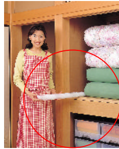
●除湿棒®・押入れ用