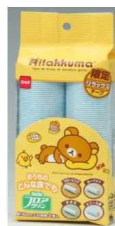
【リラックマ スペアテープ コロコロフロアクリン 2巻入】