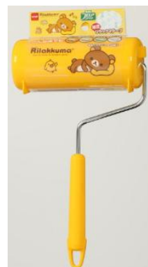
【リラックマ コロコロ フロアクリンS】