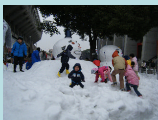
人気のスノーワンダーランド