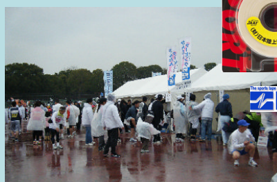
テーピングサービスの巻き巻き隊